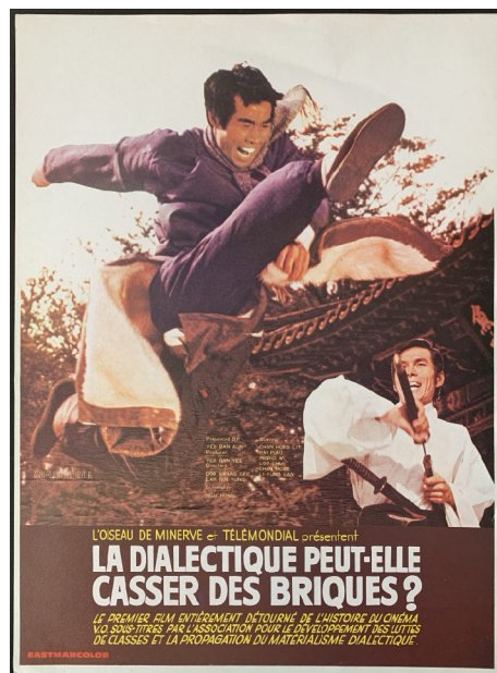
René Viénet, La dialectique peut-elle casser des briques? , 1973

Détournement d'un film hongkongais, utilisant l'humour et les arts populaires pour transmettre les messages politiques du situationnisme