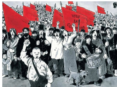
Jacques Tardi, Le Cri du peuple , Casterman, 2021 D'après le roman éponyme de Jean Vautrin, sur la Commune de Paris

La seconde partie tournera autour de l' Internationale situationniste , composée des enfants terribles des mouvements contestataires qui nourrirent mai 68 et qui devint «du plus politique des mouvements artistiques le plus artistique des mouvements politiques» 5 . Les situationnistes ont participé au bouillonnement très inventif des contre-cultures dans les années 1960-1970. Nous verrons également avec le philosophe Henri Lefebvre comment leur focalisation sur la vie quotidienne, l'utilisation de l'art à des fins politiques et l'importance de l'appropriation de l'espace dans leurs pratiques résonne avec ce qui se joue dans les espaces communs actuels.